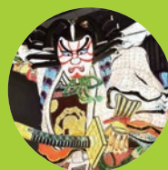
津軽半島の ど真ん中へ

●掲載されている文章は、令和5年4月1日現在のものです。●掲載されているイベント等の詳細につきましては各お問い合わせ先までお願いします。●イベントの期日・時間等、内容につきましては変更される場合があります。