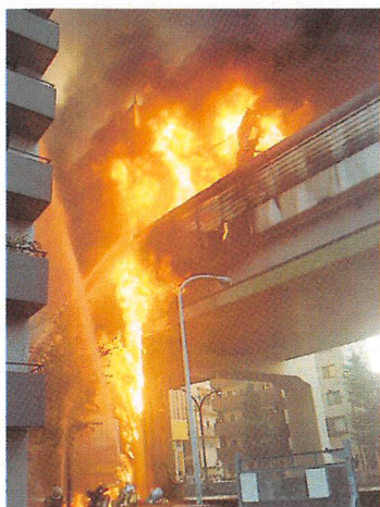
平成20年 首都高速道路 で発生したローリー火災