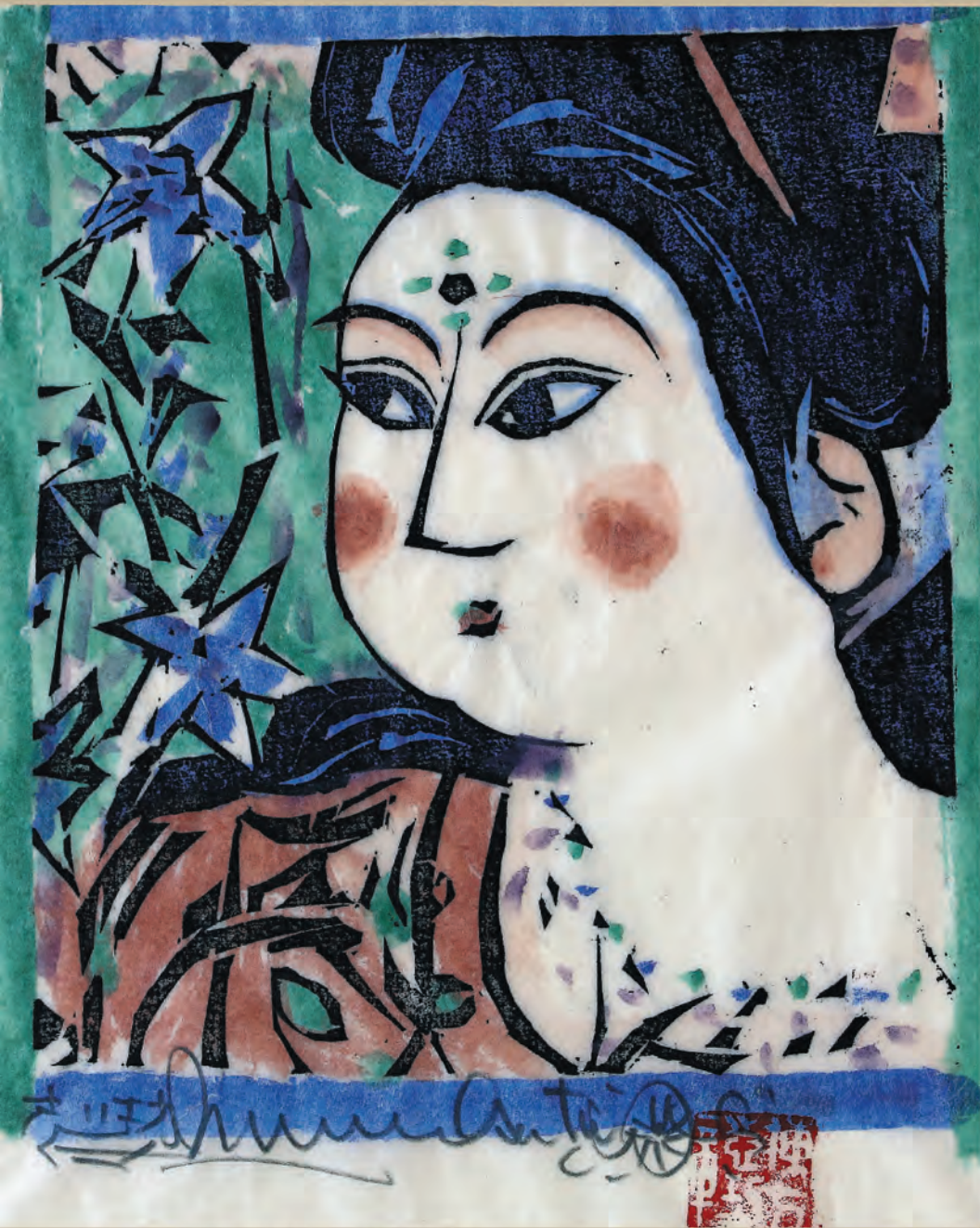
棟方志功「くちなし姫の柵」H21.5×W17cm

会場：立佞武多の館2階 美術展示ギャラリー 期間：令和2年8月28日(金)～11月29日(日)