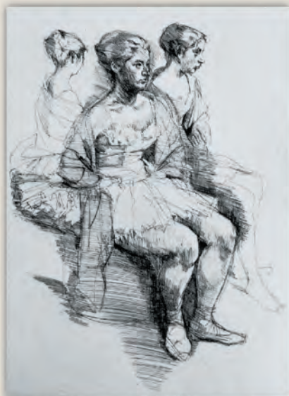
小磯良平「バレリーナ3人」エッジング H35.5×25cm