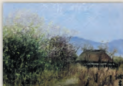
向井潤吉「梅咲く径(秩父)」H24×32cm