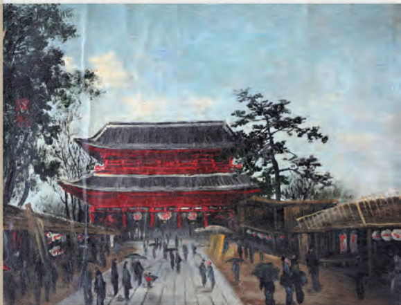
橋本雅邦「浅草寺 仁王門」H15.5×W19cm