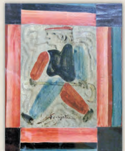
藤田嗣治「人物(水兵)」H18×15cm