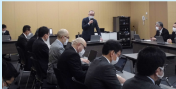
新型コロナウイルス感染症対策本部会議の様子

未だコロナ収束の見通しは立っておりませんが、一日でも早い収束を願うとともに、この災禍によって浮き彫りになったさまざまな問題に果敢に取り組んでまいります。