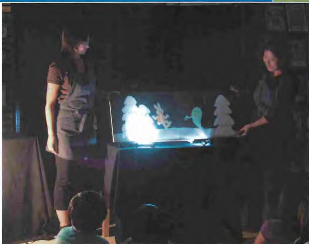
「夜の図書館こわ〜いおはなし」 平成 24 年 7 月 27 日開催