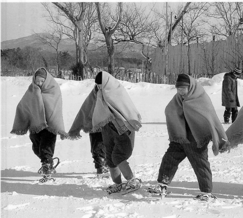
新雪の感触を確かめながら、一歩づつ前進

一月二十二日、関東・関西・九州地方から、十二名が参加し、地吹雪体験ツアーのオープニングが藤枝地区で行われました。最初に、角田助役が「津軽の厳しい冬を思い存分、楽しんでください。」とあいさつを述べた後、参加者たちは、地吹雪体験に着用するカンジキの履き方等の説明を受け、モンペ、カンジキ、