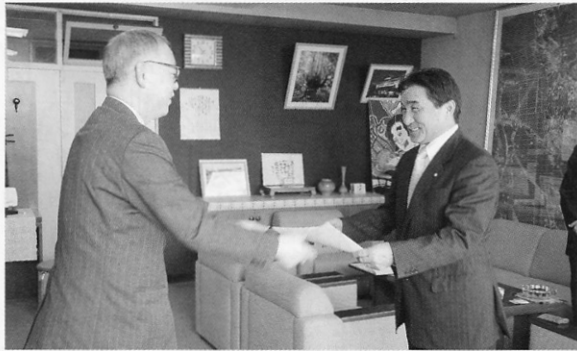
笑顔いっぱい町長

旧津島家は、西北五地区で指定されている旧平山家住宅に続いて二番目、県内では二十九番目の指定となり、三月