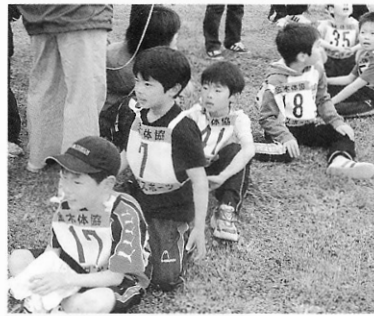
僕たちガンバりました。

この大会は、青森県民駅伝競走大会選手一次選考会を兼ねており、各種目コースに分かれ、家族や友人知人らの声援と拍手を受けながら健脚を競いました。