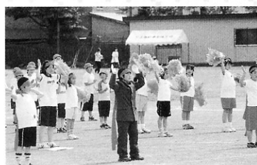
息の合った応援合戦