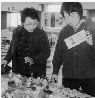
買い求める来場者

作品展示は、地元の大東ヶ丘サントピアホームの人たちが心を込めて作った絞り染めと花鉢の展示販売や近隣障害者施設のさをり織りや木工クラフト製品が町・県内で活躍している一般の方々との作品と一緒に発表されていました。 会場には多くの方々を訪れ、お気に入りの作品を買い求めています。