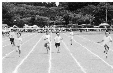
もう少しだ! 頑張れ!