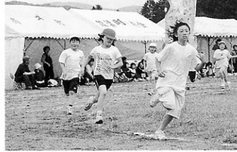
ゴールはもう少し