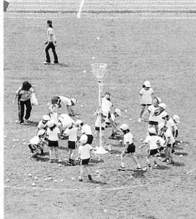
コリヤア難しいぞ!