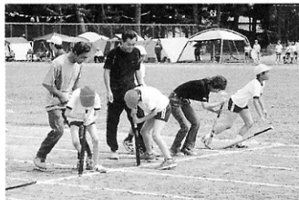
目がまわるよオー。