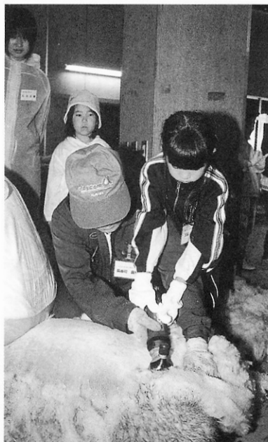
羊さん衣替えしましょう。

開講式の当日は、県内から十六組四十二人の親子が参加し、田植えや羊の毛刈りなどの体験をしました。羊の毛刈りを体験した女の子は「難しかったけどキレイに刈ることができた。とても楽しかったです」と参加した喜びを笑顔で話しました。この体験学習は十月ま