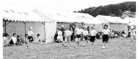
お〜い。どこへ行くの?