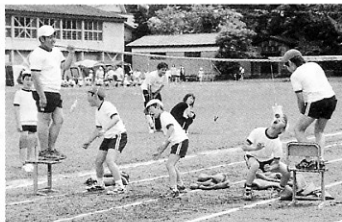
早く! 食べたいよーん。