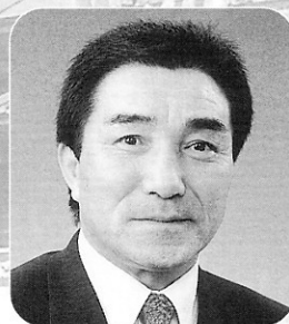
町長 鳴海 義男

希望に満ちた輝かしい平成十五年の新春を御家族お揃いでお健やかに迎えのことと心からお喜び申し上げます。