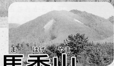
ま はげ やま 馬禿山

金木川の8キロほど上流に位置する八の字型で標高175mの馬禿山。この中腹にある赤土は、義経一行の馬の足跡で禿げたとするものや、一行の船が衝突してできたものと伝えられている。