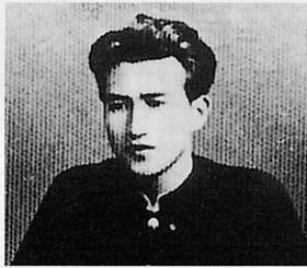
▲東京帝国大学一年生のとき

東京帝大一年生、満二十一歳で分家除籍された太宰治は、 「私には、すべての肉親と離れてしまった事が一ばん、つらかった。」(『東京八景』へわれひとり悪者として勘当除籍、家郷追放の現在、いよいよわれのみをあしざまにのしり、それがために四方八方まるく治まり居る様子。)と、『帰去来』に書いている。修学途上にありながらの分家除籍とは、体のいい「義絶勘当」ではないか。本人の気持ちからすれば無念であったことも事実であろう。