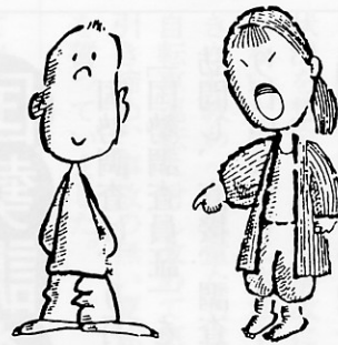
▲「雀こ」の主役、マロサマとタキ

泣いた一羽は、どんなに泣いても足りねではな。」となるようです。取り残されるといふ不安がつきまとうのですが、同時に子供同士の知恵比べでもあり、誰が誰に好意を抱いているのかを感じ取れる遊びですので、子供たちは夢中になるのです。