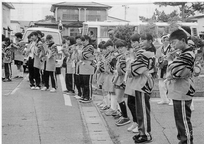
▲嘉瀬小学校前で演奏する子どもたち 新しい半天がよく似合う