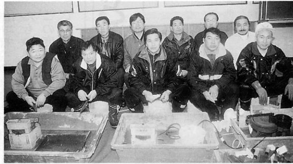
▲住宅無料相談日に集まった同建設工業部会

活動は、同部会の日頃のご愛顧に対する感謝と今後の消費拡大を目的に、毎年二月上旬に住宅無料相談日を開設。住まいのホームドクター・家の新築、増築、改築、修理、住宅資金などその他、住まいについての一切の相談内容を受け付け、私たち建築組合の各部会が指導を担当します。これに合わせて、当日家庭用包丁を無料で研ぐサービス