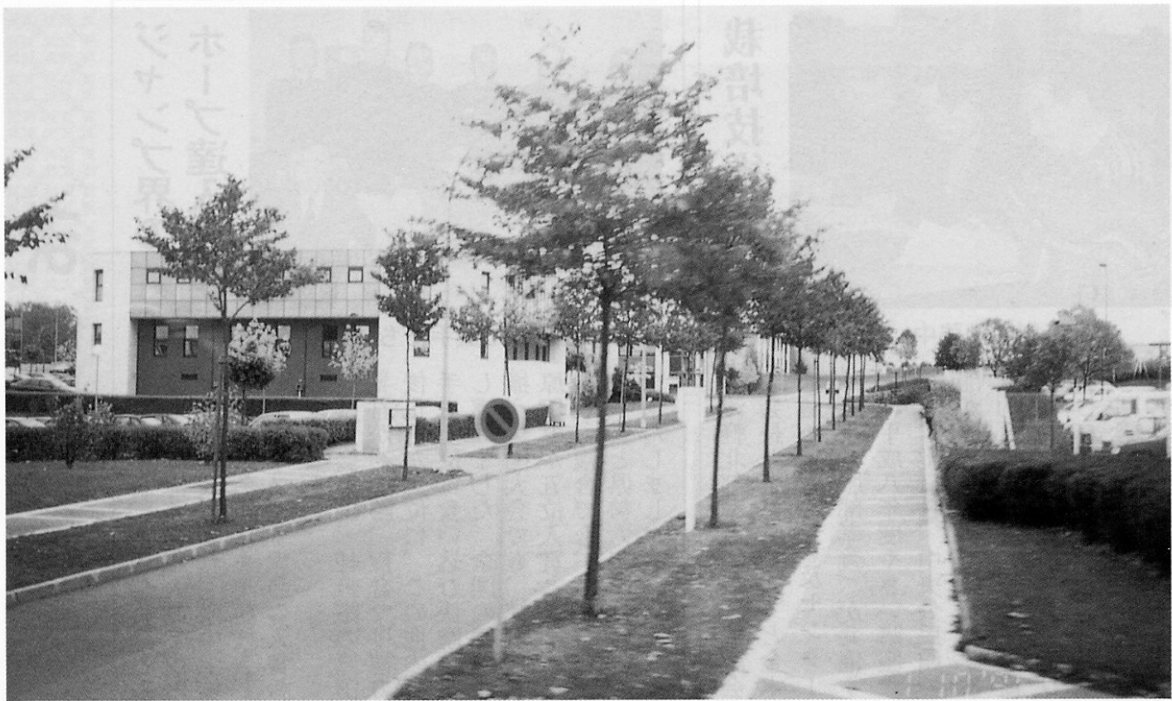
◀都市開発地区の工業区域

旧市内は保存地区として、ことから、市街地に隣接する地区に一九八三年から、総面積二百五十ヘクタールに及ぶ都市開発事業を実施している。この事業の特徴は、開発地が住宅専用・工業・商業サービスとの三つに区分されており、どの地区においても景観を重点においた整備が行われていた。例えば、商業・工業地区においても、建物の高さ制限敷地内の植栽の義務付けがある。住宅地区には、地上には建物の他には街路灯があるだけで、電線・電話線・ガス管・水道管・下水道管などが地中に設置され、分譲住宅の駐車スペースは地下室に設けられていた。市では、この開発地区内の土地を売り渡す際は、実費以下で売却している。 最後に、市のそれぞれの政策が重点かつ長期的に行われていること、自然環境を重視したものであることを実感しました。 広報十二月号から四回にわたり報告した「欧州の農業・福祉・環境と歴史を訪ねて」は、これで終了になりました。