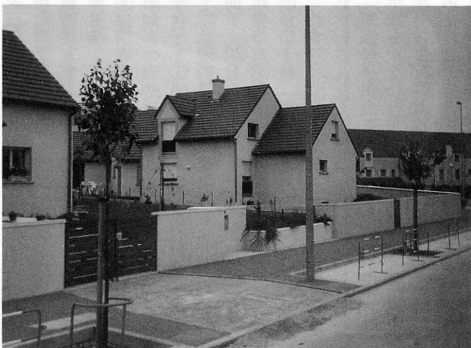
▲街灯以外地上にない住宅地

や戦争等から免れたため、ゴシック調の公的建物、民家、宿舎、記念物が数多く残っており、市はその保護と活用に取り組んだ。まず市の中心地区を保存区域に指定、地区内住民との協議を重ねて、道路については歩道を広く、車道は車が通れる幅とし、路上に駐車できないようにした。その対策として地下に駐車場を整備している。広くした歩道には石畳やモニュメントを配置し、歴史ある街並みと調和