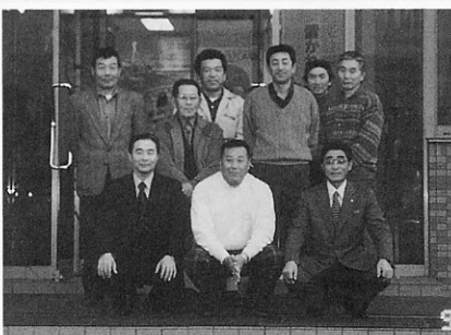
▲(株)尾之内工務店の皆さん

そして、持参した当町で今年から試作した梅ジュース「うめロマン」で杯を交わしながら「もう一頑張りして」金木町での再会を楽しみにして、無事指導相談会を終えることが出来ました。