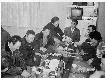
▼中部重機工業(株)の皆さん