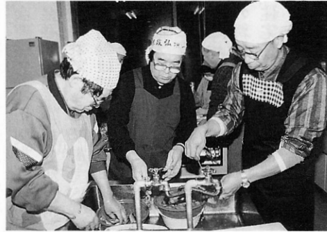
▶今おいしいのが出来ます

男ならではの料理を極め自分の健康管理と食生活を見直そうと二月五日、金木町保健センターで「男の料理教室」が開かれ、金木町食生活改善推進委員十人の指導の下男性十二人が参加しました。