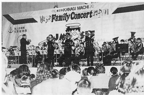
オーケストラの演奏にみんな酔いしれています

町民の皆さんに生の演奏を楽しんでもらおうと、商工会が中心となり、「第二回金木町ファミリーコンサート」が二月二十二日、農業者トレーニングセンターで開催されました。コンサートは、海上自衛隊大湊音楽隊がホイトニーヒューストンのデビュー曲「すべてをあなたに」や吉幾三の「酒よ」、テレビアニメ「クレヨンしんちゃん」や映画「ロッキー」のテーマ曲などを演奏。悪天候をよそに集まった約四〇〇人の町民はオーケストラの生演奏に酔いしれていました。