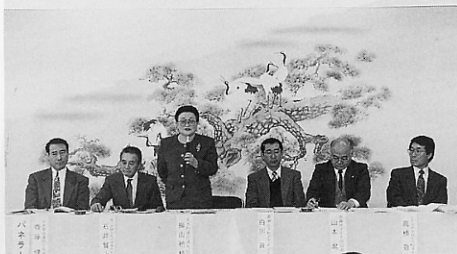
問題提起するパネラーの皆さん

去る二月十一日、中央公民館で「第一回金木町青少年育成町民大会」が開催されました。大会は、二十一世紀の金木町の担い手となる青少年の教育課程を探り課題解決の方法を考え、さらに町民挙げて青少年教育の推進に当たる決意をする目的で第一回目のテーマを「子供を宝として大切に育てる町金木町」―学校、家庭、地域の役割―として行われました。