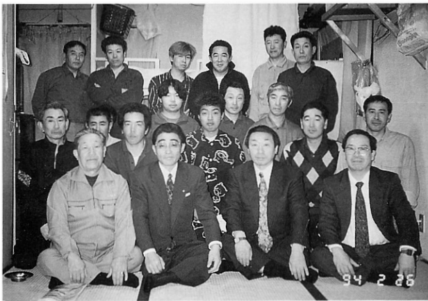
▲栄商事のみなさん