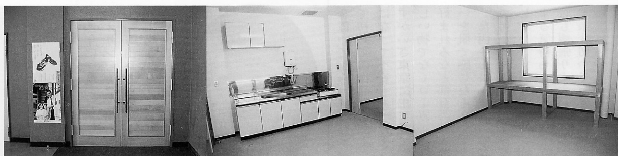
総ヒバ造りのドア