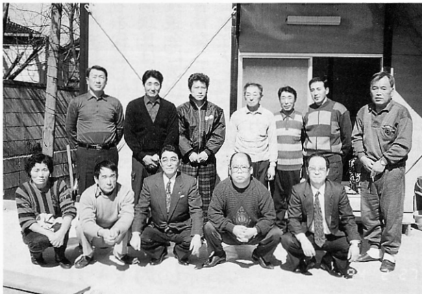
▼今井産業のみなさん