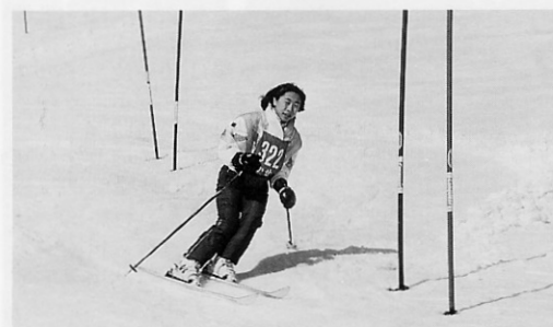
きれいに旗門通過