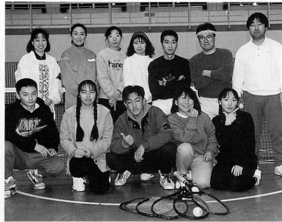
みんなでテニスを楽しもう