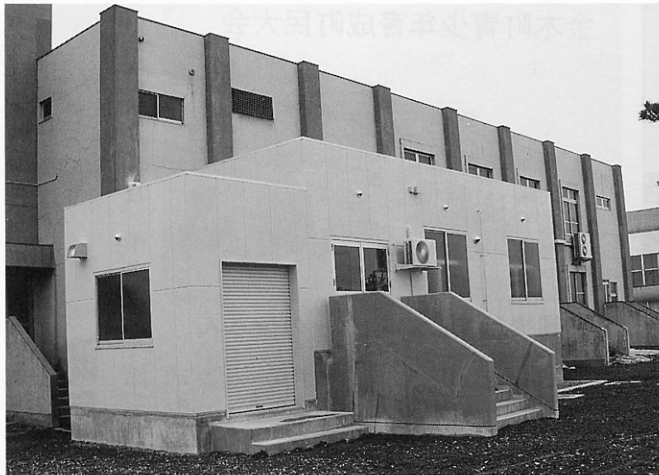
▲新築された準備室等