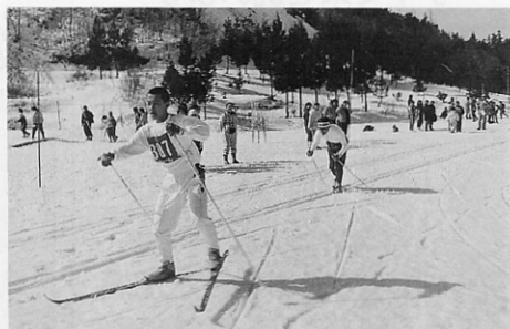
さあ、ラストスパートだ!