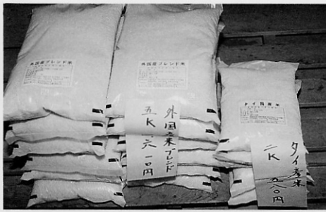
ブレンド米とタイ産米

とうとう金木町にも外国産米がやってきました。消費者としては、いろいろ不安のある外米ですが、今年の新米が出回る秋までは国内産米の単品は無く、すべての米に外米がブレンドされることになり、必然的に外米とのブレンド米を食べなければなりません。これからは調理方法を研究して外米と上手に付き合っていきましょう。