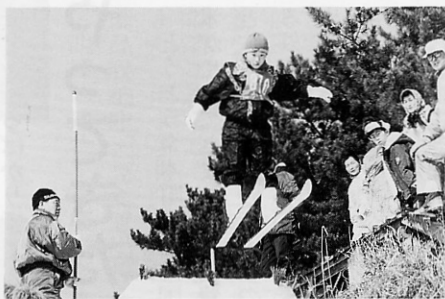
さっそうとジャンプ