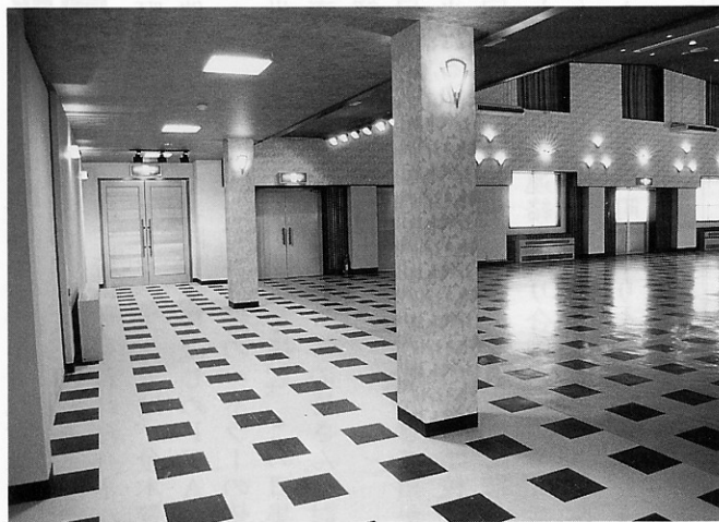
▼ホールは15.3坪広くなりました