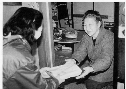
「ふれあい弁当」どうぞ

このほど、町と社会福祉協議会が一人暮らし老人の皆さんに、手作りのお弁当を食べてもらおうと六十五歳以上の