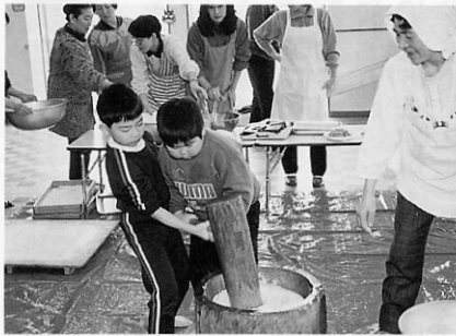
うまくつけるかなあ

旧正月の二月十日、第一保育所で母の会主催の餅つき大会が行われ、子供たちは楽しい一時を過ごしていました。