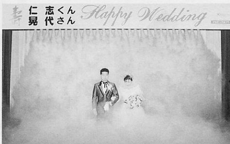
ナイアガラドライアイスによる幻想的な入場