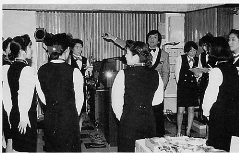
スタッフの入念な打合せ