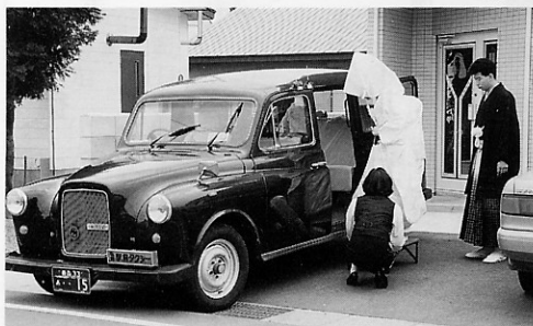
30組目を記念しロンドンタクシーで披露宴会場まで