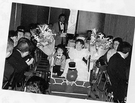
鶴亀号に乗って花束贈呈

一生残る思い出を地元金木町の手作りブライダルで、しかも活性化にもつながるとすればこれほど喜ばしいことはないでしょう。