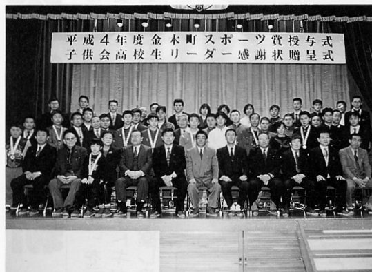
スポーツ賞、感謝状を受けた方々