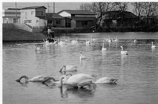
この白鳥たち来年も来るのかな

三月に入ってからポツリポツリと嘉瀬の清久溜池を訪れ羽を休めていた白鳥が、中旬頃には五十羽を超すほどになり近所の子どもたちに人気を呼んでいました。この清久溜池に白鳥が来たのは初めてで、異常気象で異変が起きたのではと心配する方もありましたが、子どもたちは大喜びで「来年も来てね」とエサを与えていました。