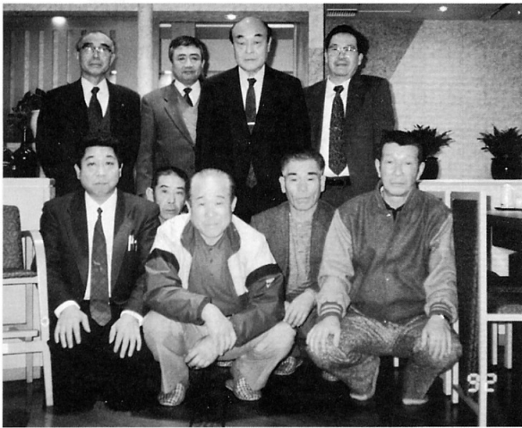
▼羽工建設のみなさん