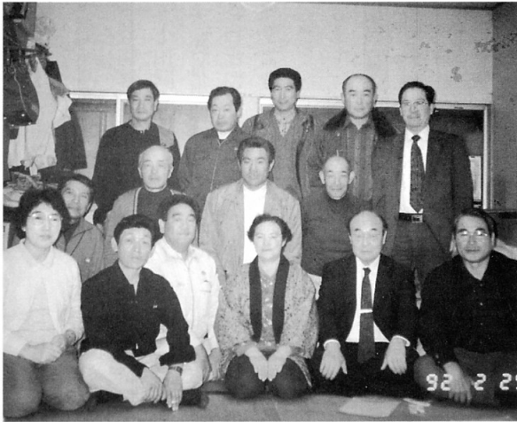
▲谷内建設のみなさん