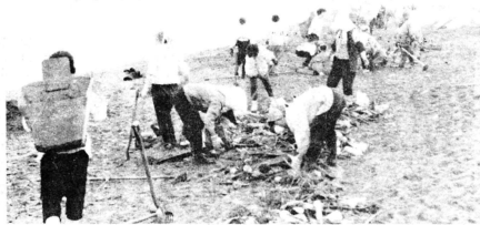
海浜の清掃を奉仕する脳元小PTAの人たち