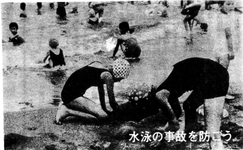
水泳の事故を防ごう