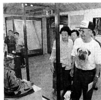
▲十三湊特別展を見学