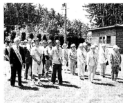
▲大会に参加したみなさん