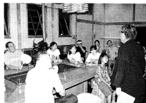
▲津軽弁教室「あくど、すねから」???