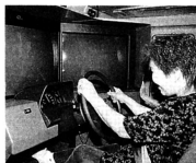
▲運転操作をチェック