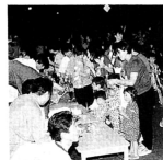
▲何が当たるか楽しみ