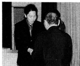
▲新成人代表に記念品が贈られました(記念品は大人のマナーエチケットブック)

八月十四日コミュニティセンターを会場に、平成十一年度成人式が行われました。 成人式には、昭和五十四年四月一日まで生まれ、対象者四十二名のうち二十八名が出席し、級友との久しぶりの再会を喜び合っていました。