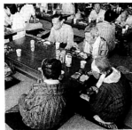
▲「長寿弁当」に舌づつみ