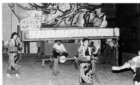
▲休憩地点では各団体が踊りを披露