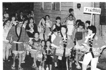
▶アトム保育園児たちも参加しました