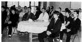
◀軽装での参加者が目立ちました