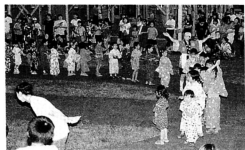
▲園児みんなで輪になり踊りを披露

七月二十七日、アトム保育園で「夕涼み会」が行われました。夕涼み会では、園児がかわいらしい浴衣姿で保護者らと参加保育園が準備したアイスクリームやおでん、金魚すくい、ヨーヨーなどの手作りの夜店が並ぶ中、園児たちはつりあげたヨーヨーをお母さんらに見せ喜んでいた。最後は、豪華商品が当たるビンゴゲームで盛り上がり、夕暮れ前のひとときを楽しんでいました。