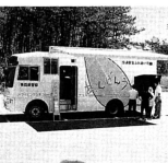
▲安全運転「ふれあい号」

このシミュレーターは、青森 県警が東北で初めて導入した 「ふれあい号」。市浦村への来村 は初めてで、この日は、四十人 の村民がシミュレーターを使い 疑似運転体験をしました。