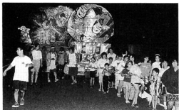
▲十三子ども会一生懸命ねぶたを引きました▲