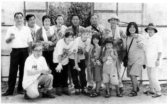
▲トマトの収穫を体験したしうらキッズ参加者