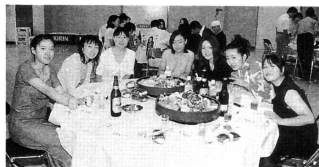
◀笑顔がこぼれる新成人たち