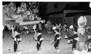
▲ドラエモンねぶたも出現