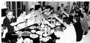
▶市浦の特産物で夕食「かんば〜い」