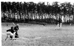
▲熱戦が続いた夕焼け野球大会