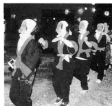
▲誰なのかわかりません