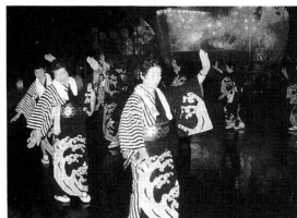
▲雨にもかかわらずにぎわいを見せた前夜祭