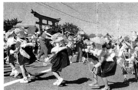
▲元気いっぱい小馬踊りをハネました