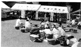
▲天候にも恵まれ多くの参加者がありました

この他にも豪華な商品が当たるお楽しみ抽選会やビアガーデン、パーベキュー、しじみ汁おでんの販売も行われ、参加した人たちは市浦村の文化・味覚・自然を満喫していました。