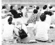
▲芸能発表に惜しみない 拍手が送られました