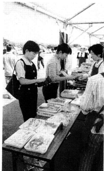
▲当日は市浦牛の即売が行われました

会場内では、十三湖のしじみ、市浦牛、野菜の販売や、小泊村、中里町からも出品されて賑わいを見せていました。また、相内の虫送り、相内の坊様踊り、脇元の小馬踊り・十三の砂山等の郷土芸能が披露され、会場を盛り上げていました。