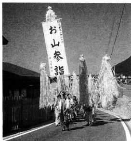
▲サイギサイギのかけ声をかけながら 露山をめざします