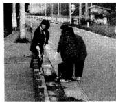
▲清掃活動でご苦労様でした

川敷清掃や大間越一〇一号線清掃、五所川原市街地ロドリムラ清掃等を実施しています。また、通年的には書き損じた郵便ハガキを回収して青森県うら協会への支援金贈呈も行われており、組合員の皆さんは「今後とも積極的な活動を継続していきたい」とはりきっていました。