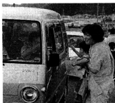
▲脇元保育所による街頭指導

主な活動として、相内バイパス、脇元シーサイド前、十三小学校前で街頭指導が行われ、脇元地区では脇元保育所の児童が実施、ドライブインシートサイド前で作手作りのマスコットをプレゼントしながら交通安全を呼びかけていました。なお、このマ