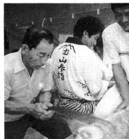
▲丸太切りは体力で勝負

五穀豊穡と家内安全を願う、脇元岩木山神社大祭「お山参詣」が九月二十日・二十一日の両日（旧暦の八月一日）にわたって行われ、二日間で約四百人が参加しました。