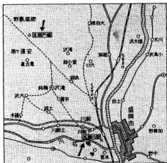
厨川柵址地図「日本史蹟大系」所収

ことごとく、ようやく案内図を示してくれました。厨川柵とはいつていなかったのです。いや、知っていても知られていなかったのかも知れません。現在ではりっぱな標識が立てられています。草が茫沓として私の背丈よりもびてている状態でしたが、現在では観光の一つの目玉になっています。北上川と平石川の合