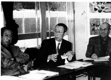
グループワークでは、活発な意見討論が繰り広げられる

十二月六日、村コミュニティセンターで、第二十五回共同保健計画会議が、関係者約百人出席のもと開かれました。