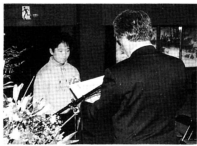
健康づくり事業功労表彰が行われた