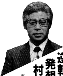
市浦村長 高松隆三

なかでも、安東の歴史資源の掘りおこしと観光開発、地場産業の振興など独自のな村づくりの施策が高く評価されたものであり、その主役を演じてくれた村民とともに、新たな決意で、つぎの事柄を基に全力で村勢の進展に取り組みたいと考えています。