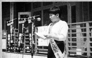
死亡事故ゼロ、新たなる記録挑戦を

津軽大風海を渡る 市浦風愛好会々員が六月十五日から十六日、北海道ノ国町夷王山まつり凧揚げ大会に参加。津軽大風が太陽の広場に舞い上がりました。