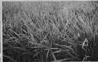
農家に大打撃、不稔障害が発生

寝たきりゼロ作戦、福祉バンクの創設等、医療・保健・福祉が一体となり、長寿の里づくりの核となる高齢者生活福祉センターのオープンが待たれています。