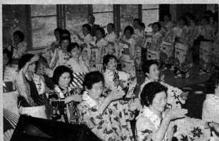
しうら音頭が完成

ふるさと創生事業のひとつ、しうら音頭が完成。 7月27日二重三重の輪が幾度も広がる発表会となりました。