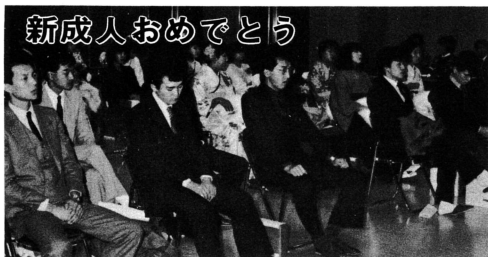
記念講演に耳をかたむける新成人