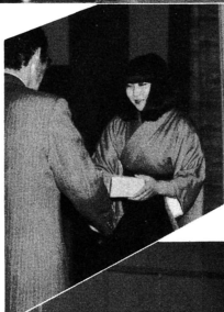
三重村長から一人一人に記念品が手渡されました