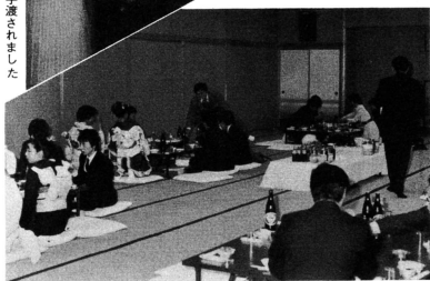
乾杯をしたあとグループになり久しぶりの顔と喜びを語りあっていました