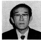
若者たちはなぜ、みるきとを捨て、市浦という村がどうして過疎になつていくのだらうか。山の村、海の村を呑みこんで肥大していく大都市の姿を、私は厳しく追求しながら

ら村民に「生きがい」と「理想的人間居住の場」を提供するために、政治や行政、地域開発のあるべき方向をどうするか日夜苦悩しているところでもあります。