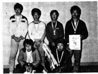
写真上：強烈なスパイクに全日本とどかず。 写真下：初優勝に輝いた水中花(中里高)メンバー

観客が声援するなか、キャリアにまさる全日本対現役の強みみせる中高が激突、好ゲームが展開されましたが、中高が2対0で全日本を下し、初の栄冠に輝きました。成績は次のとおりです。