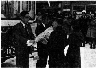
写真上：関係者がテープカットをして開通を祝いました 写真下：終点の農協前では市浦中生徒代表から花束が贈られました