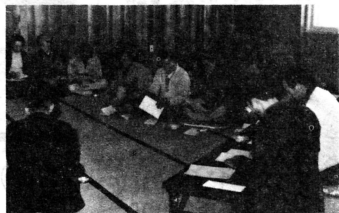
事故見舞金制度加入などを決めました

第十七回、協元出かせぎ組合の総会が一月八日、協元公民館に組合員約三十人を集めて開かれました。 「厳しい雇用情勢の中で、出かせぎ者を取りまく問題も多い。留守家族と出かせぎ者の連絡を密にして、安全で明るい出かせぎをしよう」と協元引岩組組合長があいさつをしたあと、議事には、前年度の事業、決算が報告され、新年度の予算、事業計画も全会一致で承認しました。 主な事業としては、退出かせぎ協会(事故見舞金制度)への加入を強力に促進することとを柱に、①村と留守家族、組合員の連絡を密にする。②労働災害の防止と健康管理につとめ、安全就労をする。③組合員相互の親睦を深め、資金不払い、契約違反の防止を図る。④就労前の健康診断の実施など。 また、村企画室の出かせぎ担当からは、昨年五月からスタートした事故見舞金制度の状況説明があり、市浦村の県出稼協会への加入者は百八十八人で、そのうち四人の方々が負傷して見舞金の給付を受けていると報告され、万一人に備えての出稼協会への加入を呼びかけました。