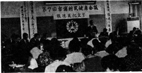
—環境美化の村を宣言した健康会議場—