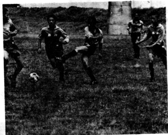
市浦中対板柳中は……1対1の引き分けでした

ら三日間、青森市で開催されますが、二十五名の部員は、毎日が暮れるのも忘れて練習に励んでいます。