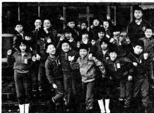
脇元小学校四年担任

そのような気がする。五分の休み時間でも時おしげに縄を持ち体育館へと猛烈なスピードで走って行き、頭から湯気を出して教室へ来る。「それはよく汗かいて勉強できるが」先生、気持ちスリットした。頑張るはんで心配しなくてもいいね。憎めない言葉に思わず苦笑することがある。係り活動で自分の仕事を黙々としているK君。いつも教室をきれいにしているM子さん。一つで私のお手伝いをしてくれるG君、A君。節分の日を忘れていたら皆さんでお金を出しあい、豆を買って用意して来るなど、自主性があり、一つの目的に向かって皆さんが協力する態度が身についているようである。二十四名中、女が七名の男中心の学級に思えるが、なかなかどうして、行動力など五分と五分である。