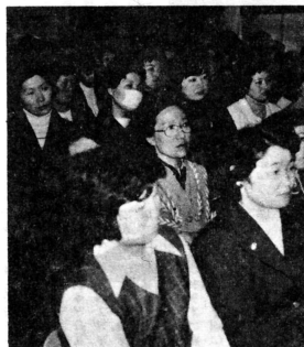
わが子の研究発表に目を細める父兄……全体会議場で。

脇元小学校では、今年も一月三十一日「両親参観日」を開き、日ごろ子どもの勉強ぶりに接していないお父さんたちから大変喜ばれました。 この両親参観日は五十年前から毎年開いてきたもので、出かせぎにでかけたお父さんが、お母さんと手をたずさえて学校をおとすれ、この日集った父兄は百五十人。全体会議場にあてた音楽室には入りきれないほどでした。 三年生の学級では、子どもたちが大きな病院がほしい。「お父さんが出かせぎをしなく、てもよい工場がほしい」など市浦村の将来について勉強していました。 そのあと、一年生の人形劇「ももたろう」や、冬休み中に子どもたちが行った研究発表などがあり、元気なわが子の姿に夫婦そろって目を細めていました。 日ごろ学校には縁遠いお父さんたちも、この日の授業参観で、安心して出かせぎに行ける。「今年も元気で頑張らなくては」と話しあつていました。