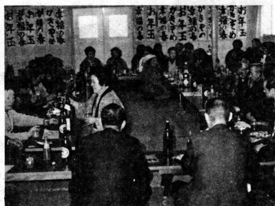
今年も安全で明るい出かせぎを……和やかに懇談する十三出かせぎ組合員