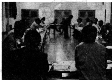
運転者としての自覚と責任を忘れずにノと関係者との話しあいをしました。