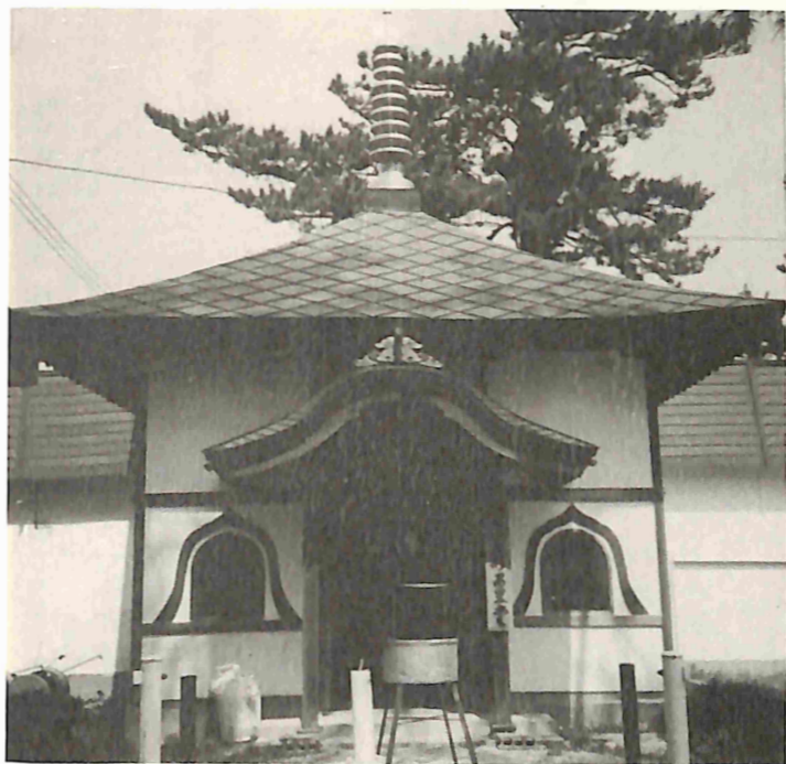
(水子地藏堂、奥に人形堂がある)

この外にも休憩室や、いろいろな建物が建てられ、川蔵賽の河原も昔の暗いイメージから脱却して、信仰と観光の地へと変身したようである。