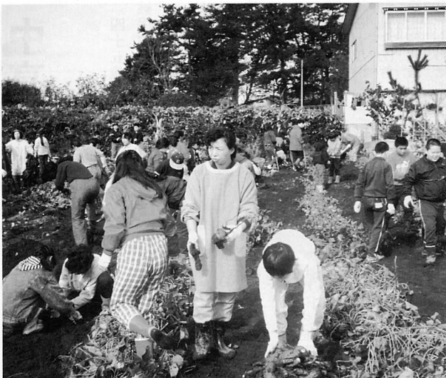
▲みんなでワイワイと

この収穫は、一父兄の協力により畑百五十坪が春から借りられたことで行ったもので、父兄四十人も手伝いとして参加、午前中一杯をかけて掘り起こした。掘り起こした量は一五〇