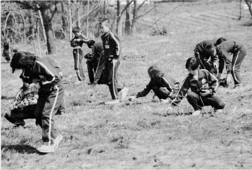
▶一心不乱にゴミ拾い（金木小児童）