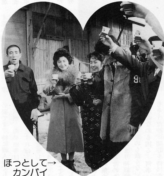
ほっとして→ カンパイ