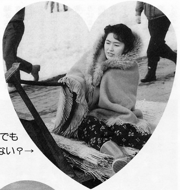
←金木にすんでも 違和感がない?→