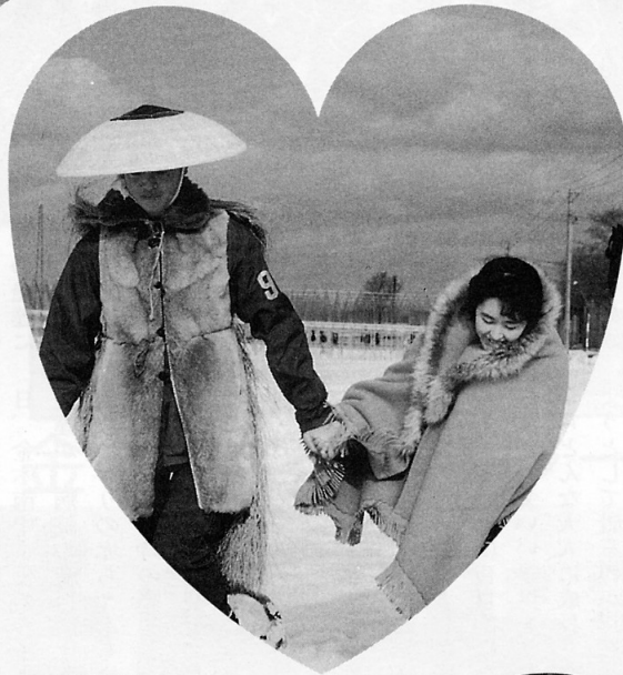
握った手痛くないかい