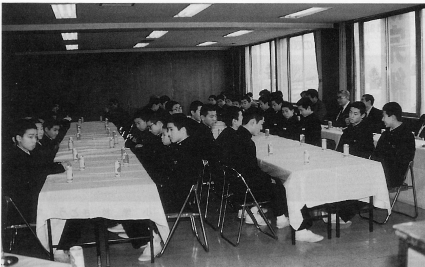
▲出席した中・高校生たち