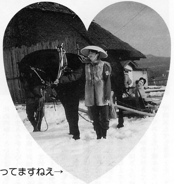
似合ってますねえ→