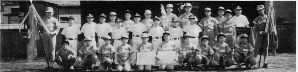
金 木 ク ラ ブ