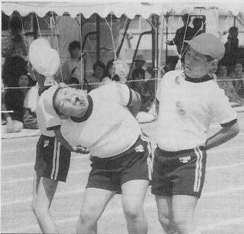
▶ 大口あけて (嘉小)