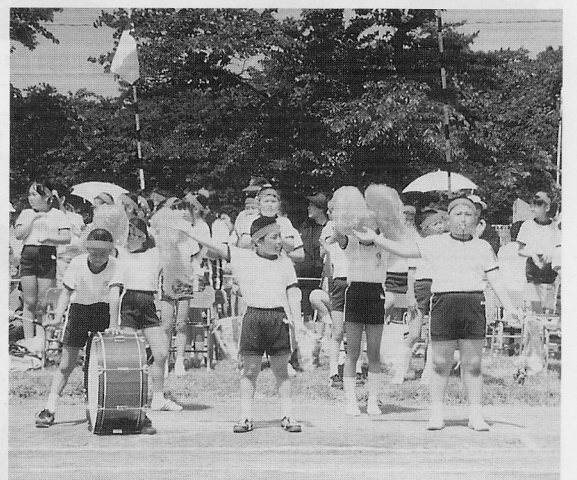
▲応援にも熱がはいる (金小)