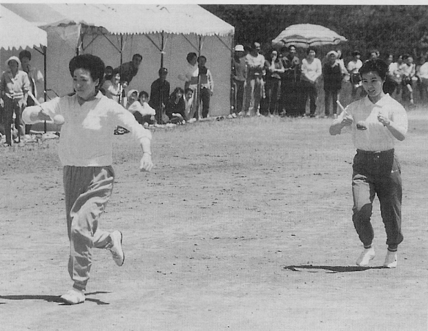
▲もってるのはしゃもじです (喜小)