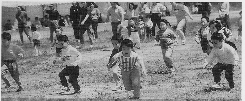
▶ 走る姿は子供が本気? (喜小)