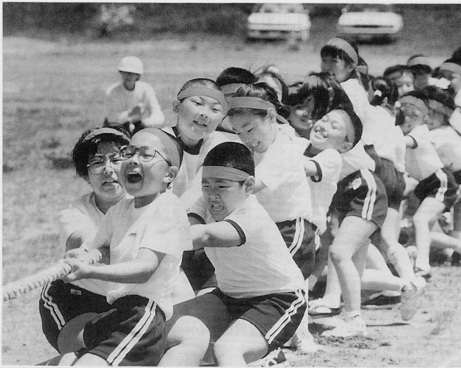
▲力をふりしぼって (喜小)