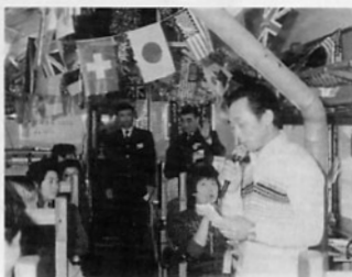
→2月21日旧正月カラオケストーブ列車での熱唱の一コマ