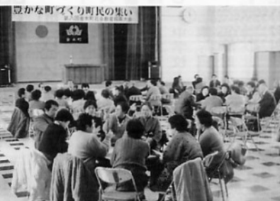
↑2月14日豊かな町づくり町民の集い(第8回金木町社会教育振興大会)が中央公民館で開かれ、町民多数が参加して住みよい町づくりのため、身近な課題について話し合いました。