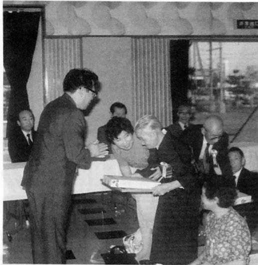
大橋町長から顕彰を受ける長寿者

「みんなで築こう豊かな老後」「社会に活かそう知恵と経験」をスローガンにさる九月八日、町中央公民館で、金木町敬老大会が開かれました。