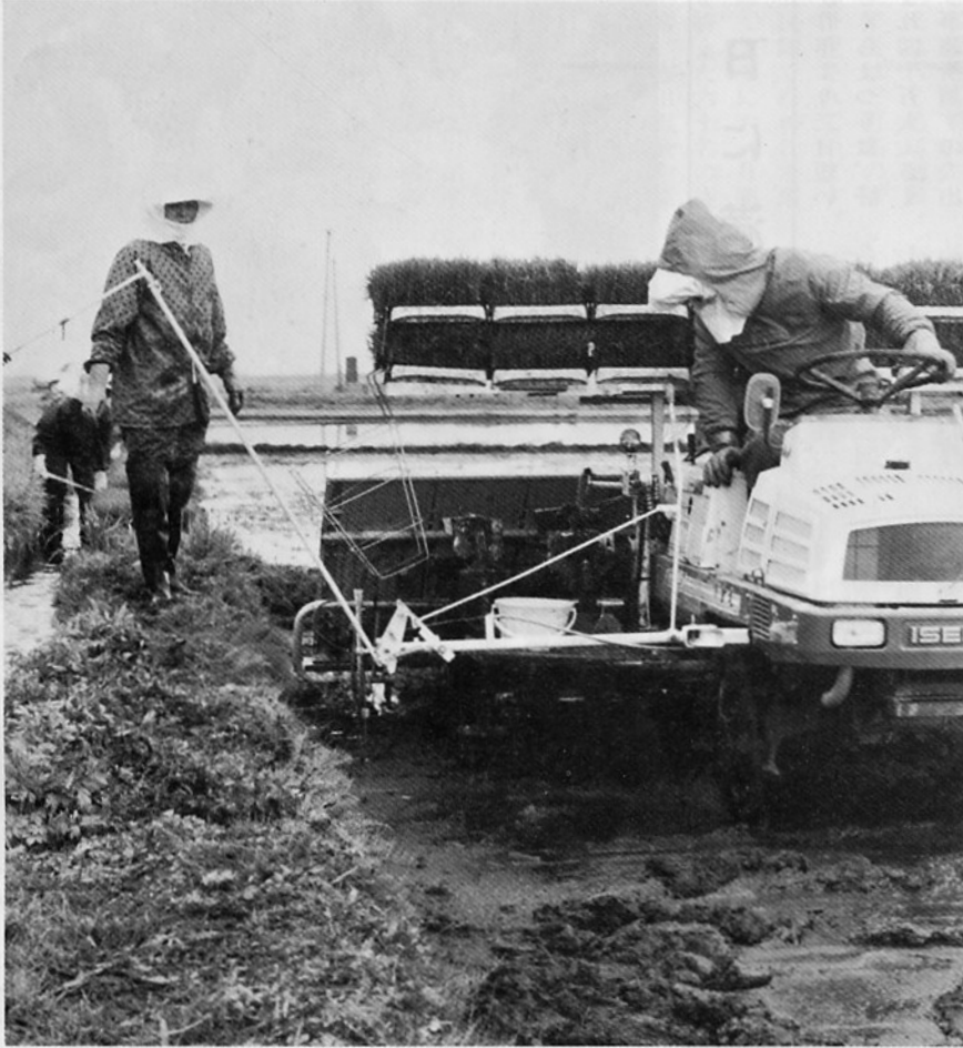
八日頃から始められた田植え——乗用型田植え機で

「猫の手も借りたい程の忙しさ」は、水稻農家にとって田植え時期。昔から「五月御免」と言われ、田植えの農繁期は、たいていの事が許されたと言う。