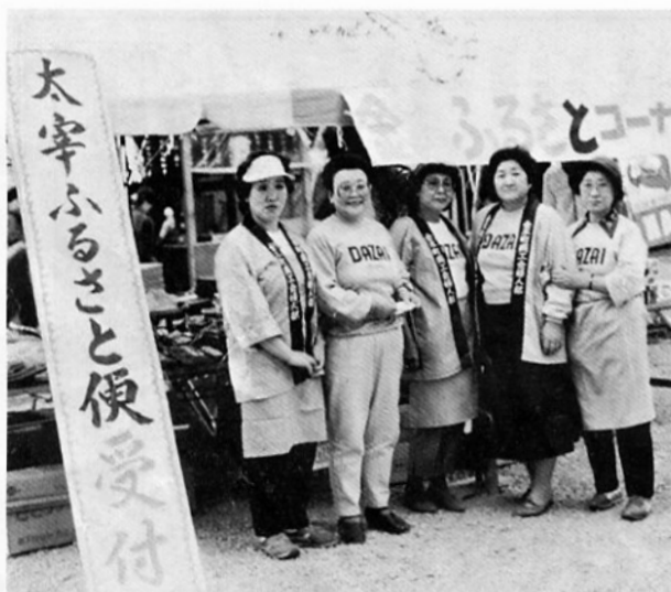
まつり期間中に行われた「太宰ふるさと便」コーナー

次いでいきました。実施にあたっては、ふるさと便では、県内の先進地である岩崎村の視察や、関係者との打合せを入念に行い、これまで観光パンフレットなどを全国へ三百通送