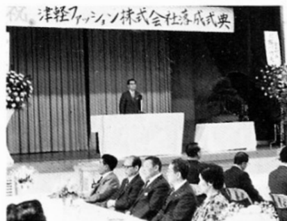
津軽ファッション株式会社落成式典