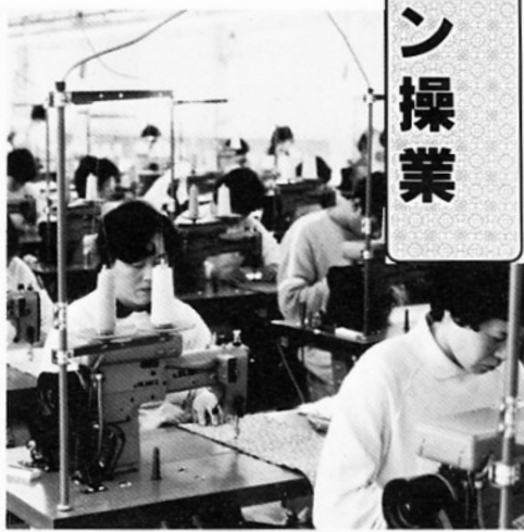
操業を開始した「津軽ファッション」