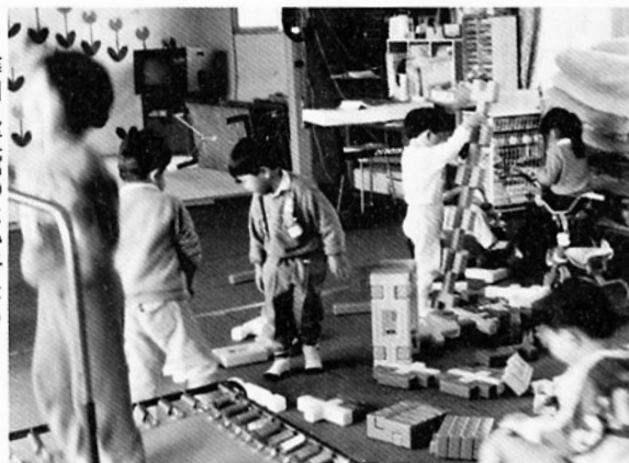
蒔田児童館のよい子たち