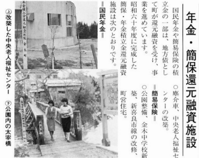
⑧ 改築した中央老人福祉センター ⑨ 公園内の太宰橋