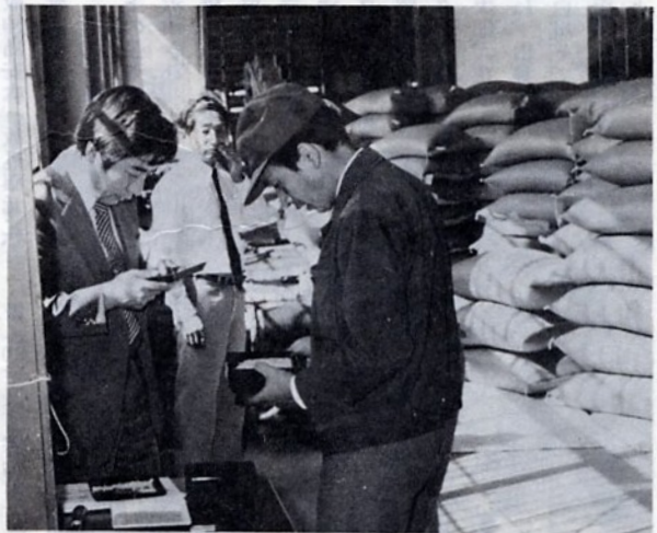
嘉瀬農協低温倉庫での初検査

町内の今年の品種別作付割合は、アキヒカリがトップで91%、次いで県の奨励品種であるむつこまちが6%第三位が、むつこまちが2%の順になっています。