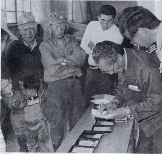
金木農協一号倉庫での初検査