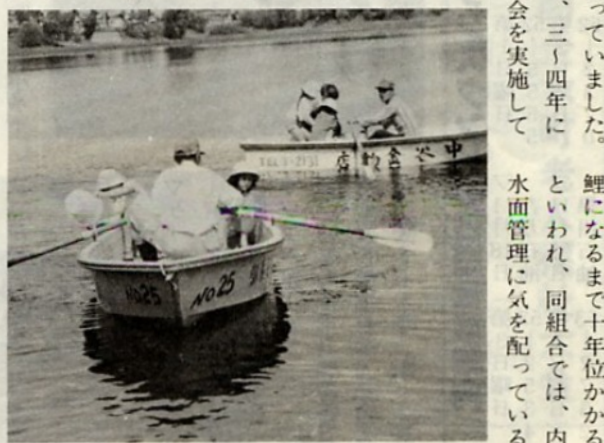
鯉になるまで十年位かかるといわれ、同組合では、内水面管理に気を配っている。