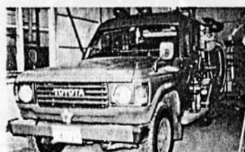
ポンプ自動車 第五分団