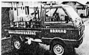
小型ポンプ積載車 第一分団