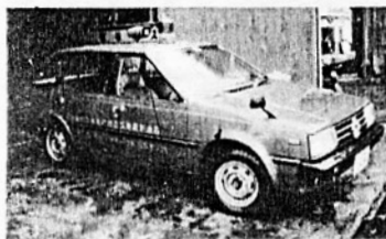
防災広報 パトロール車

国の補助金により、防災広報パトロール車、小型ポンプ積載車及びポンプ自動車を購入配備し、防災体制が一段と強化されました。しかし、これらを活用させないよう、ストーブやワロ釜などの火の元には十分注意して下さい。