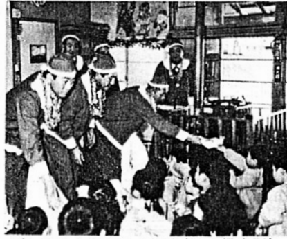
プレゼントをもらう児童(第4保育所)

さる十二月十四日、町内の各保育所や児童館、及び幼稚園をサンタクロースのおじさんが訪れ、ひと足早いクリスマスプレゼントを子どもたちに贈りました。