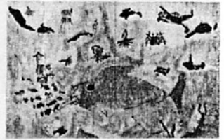
お話の絵「スイミー」 喜良市小2年 西村智道