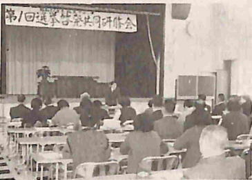
【熱心に聴き入る参加者】

北五選挙啓発共同研修会 「地域に見合った啓発活 動のあり方を求め、積極的 に活動を推進しよう」と十 二月四日、中央公民館にお いて、北五ブロック第一回 選挙啓発共同研修が開かれ ました。