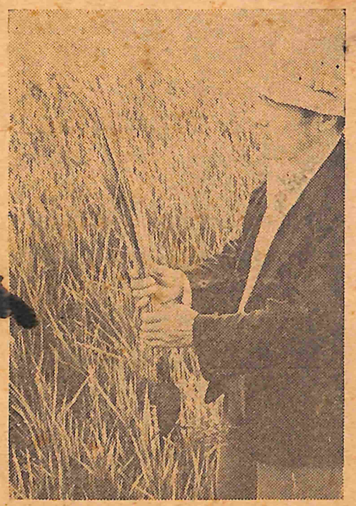
【写真一は四十年来の不作となつた青立の稲一周辺の田圃にて】

作として青刈ライ麦を栽培するもまたその方法である、次に青刈ライ麦の利用価値について述べらる。