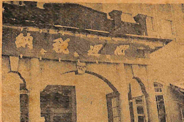
第三次納税推進運動期間

それでも本年度未納額は十二月末日現在で五、一三二、〇八四円にのり、町財政はまだまだ火の車というところ。 一月十五日から月末まで第三次の税金攻勢が入りますが、町当局では『諸施策の完遂と平交金及び補助金獲得のため何分の御協力を』と要望しております。 【写真】役場玄関に張られた横断幕