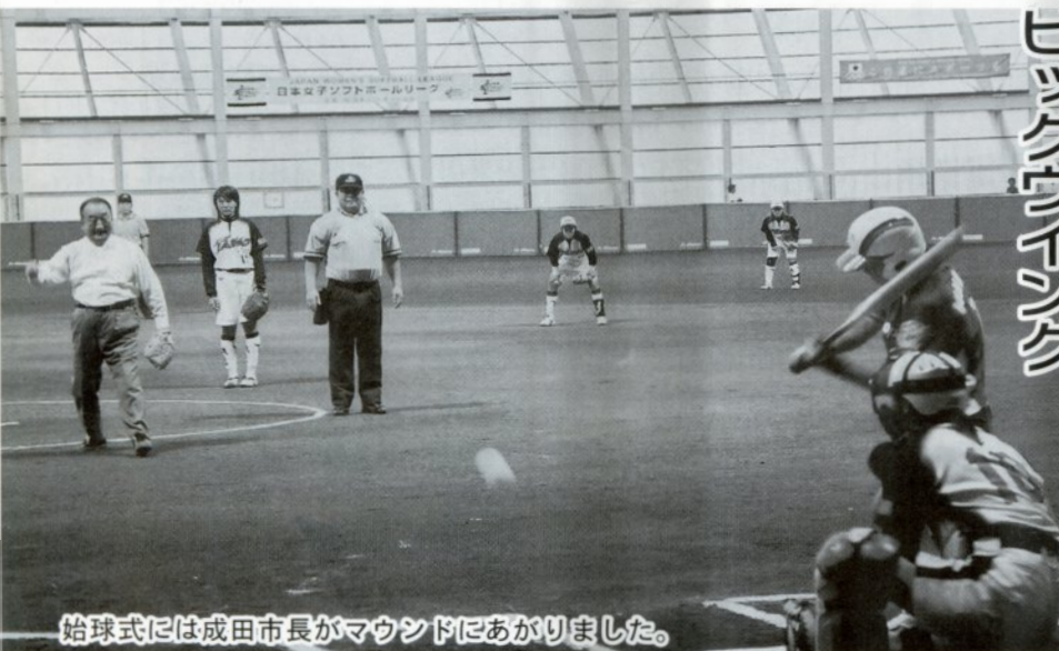
始球式には成田市長がマウンドにあがりました。

県内の中高生や一般のファンが観戦した試合では、随所に飛び出す好プレイやピッチャーが投げるスピードに観客席から感嘆の声があがり、ドーム内に響き渡っていました。