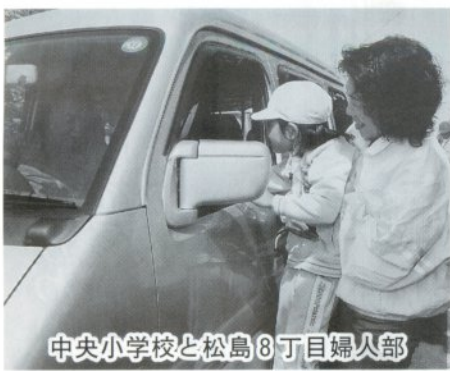
中央小学校と松島8丁目婦人部

九月二十八日、金木第一保育所年長児二十一人が斜陽館前で手作りのりんごのマスコットを配り、安全運転を呼びかけました。ドライバーたちはにっこり笑い安全運