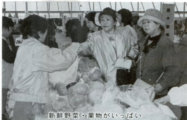
新鮮野菜・果物がいっぱい