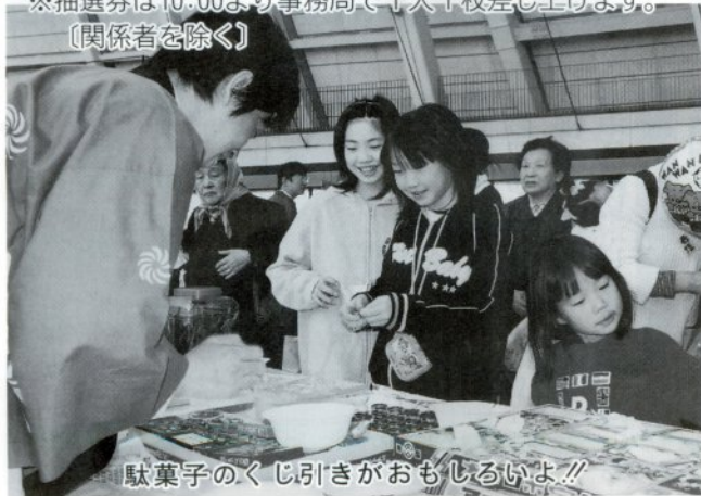
駄菓子のかじり引きがおもしろいよ!!