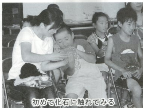
初めて化石に触れてみる

図書館では七月三十日、「夏休みこどもの集い」を開催しました。参加した子どもたちと父母ら七十人は、県立郷土館の島口さんから「化石」についてお話を聴き、10億年前の化石を触るなど、「地球のはじまり」について勉強。また、人形劇サークル「おたまじゃくし」の皆さんが、地球にとって大切な「環境問題」を人形劇で分かりやすく伝えました。