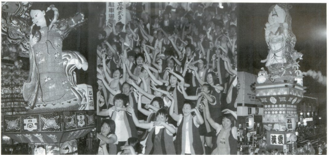
五所川原工業高校、五所川原高校、五所川原農林高校の3校もそれぞれ工夫を凝らした立佞武多で参加し、生徒達の踊りで見物人を楽しませていました。