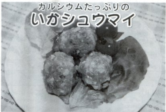
1人分 233kcal/カルシウム97mg/塩分1.3g