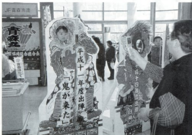
想いの写真「はいポーズ」