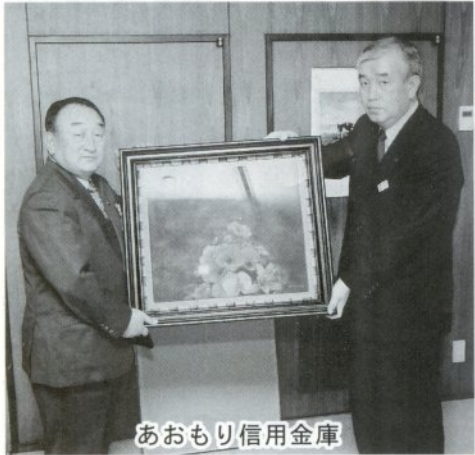
あおもり信用金庫