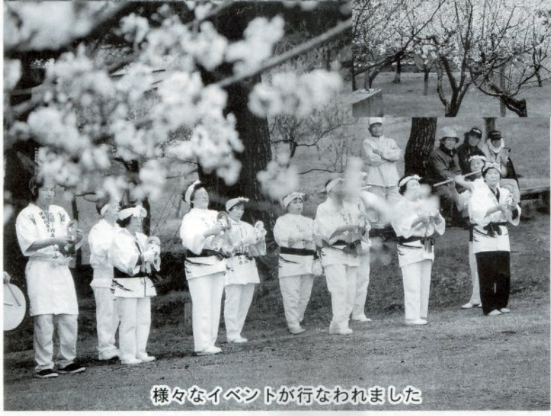
様々なイベントが行なわれました

らは岩木山が望むことができる風 光明媚な場所です。 まつり期間中は、登山囃子、獅子舞、市民ゲートボール大会、民謡ショーなどが催され、訪れた人々は梅の下で弁当を広げたり、散歩するなどして梅の花を楽しんでいました。