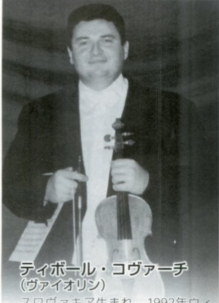
ティボール・コヴァーチ (ヴァイオリン)

スロヴァキア生まれ。1992年ウィーン・フィルに入団、現在は同オーケストラ首席奏者としての演奏活動に加え、室内楽でも活躍中。