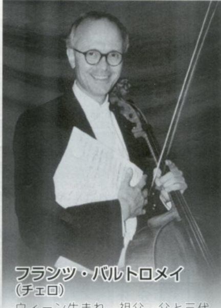
フランツ・バルトロメイ (チェロ)

スロヴァキア生まれ。1992年ウィーン・フィルに入団、現在は同オーケストラ首席奏者としての演奏活動に加え、室内楽でも活躍中。