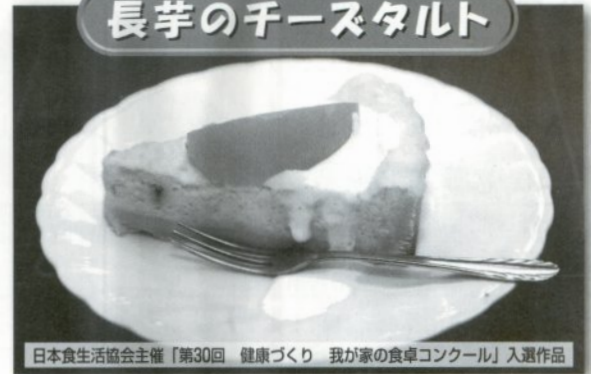
日本食生活協会主催「第30回 健康づくり 我が家の食卓コンクール」入選作品