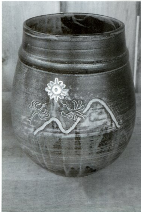
リー ソン ハン作(韓国) かめ