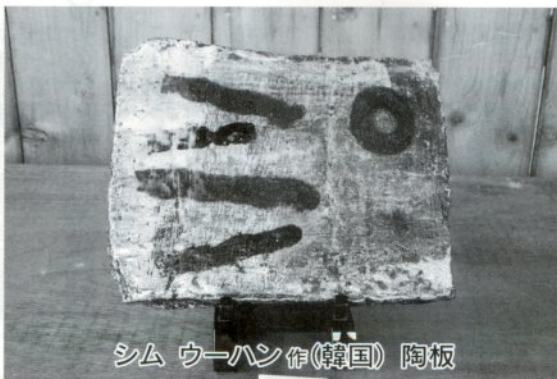
シム ウーハン作(韓国) 陶板