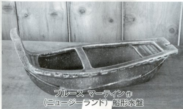
ブルース マーティン作 (ニュージーランド) 船形水盤