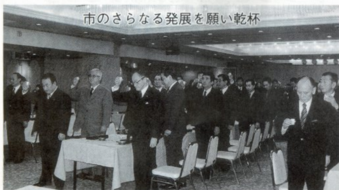
市のさらなる発展を願い乾杯

同会では、市長が「今年は（仮称）立佞武多の館の建設もあり本市にとって大切な一年となります。これからも皆様の熱意と叡智を結集して「活力ある元気な五所川原」に向け邁進していきたい」と抱負を述べました。