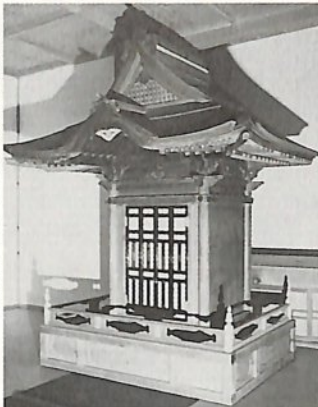
建造時期は宝暦期（一七五一～六三年）ころと推定 大きさは桁行七十センチ 梁間六十三センチ

高さ約二・二メートル。七面大明神像を安置する一間の建築型厨子で、入母屋造りの板葺屋根を載せ三方に縁が廻る。各部には細部まで行き届いた細工がなされ、彫刻は、当時のままで構造形式や技法・意匠の点からみて市内では数少ない江戸時代中期の建造物の遺構。