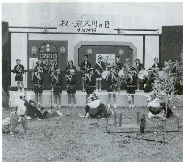
各種イベントに参加する「一六会」のメンバー