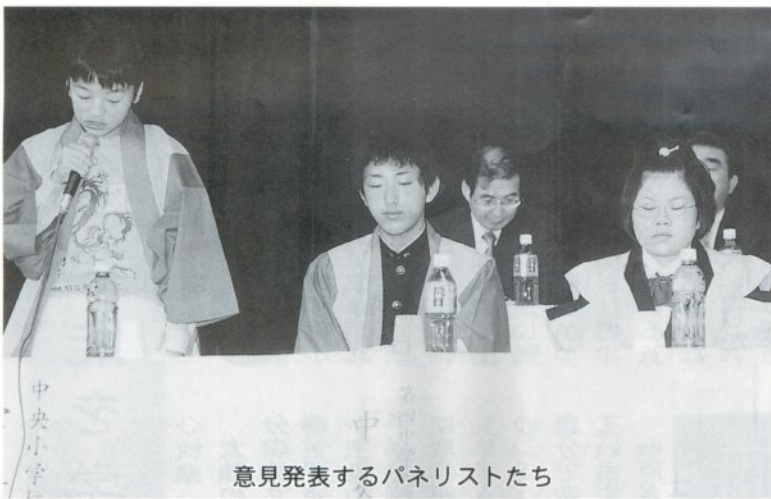
意見発表するパネリストたち

本市の夏まつりに参加した若者に明日の立佞武多を考 えてもらおうと「煌（きら）めく立佞武多応援隊21フォ ーラム」が中央公民館で九月二十九日に開催されました。 同フォーラムは、「よみがえる感動、ほとばしる若さ にロマンの祭り、立佞武多が映える我がふるさと」をテ ーマで行われ、昨年の高校生サミットに続き二回目にな ります。