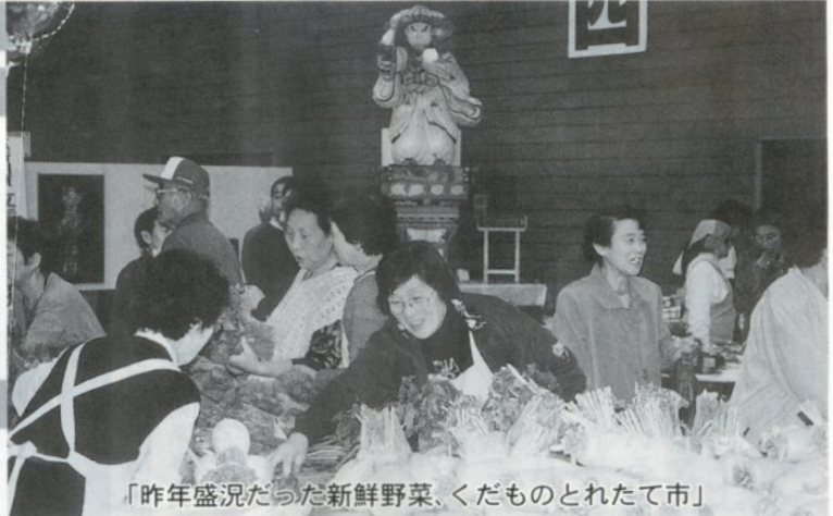
「昨年盛況だった新鮮野菜、くだものとれたて市」

開会式 9時30分 漆川獅子舞 演芸大会（老人クラブ） 子供獅子舞（藻川小） ヨサコイソーラン（中央小） 終了予定 16時