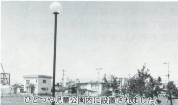
ひとつや児童公園内に設置されました。