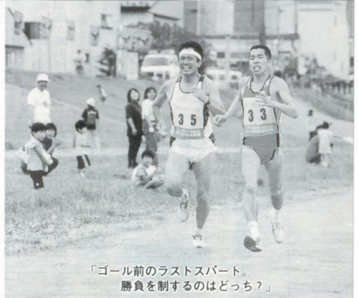
「ゴール前のラストスパート。 勝負を制するのはどっち?」

六月二十七日、北斗運動広場において第十回虫おくり健康マラソン大会が行われ、上は七十六歳から下は三歳まで、約七百人が参加し日頃鍛えた健脚を競い合いました。