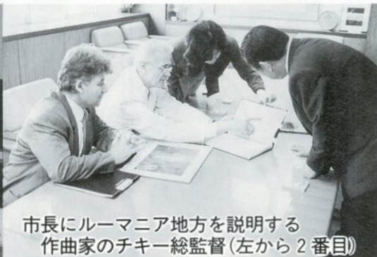
市長にルーマニア地方を説明する作曲家のチキー総監督（左から2番目）